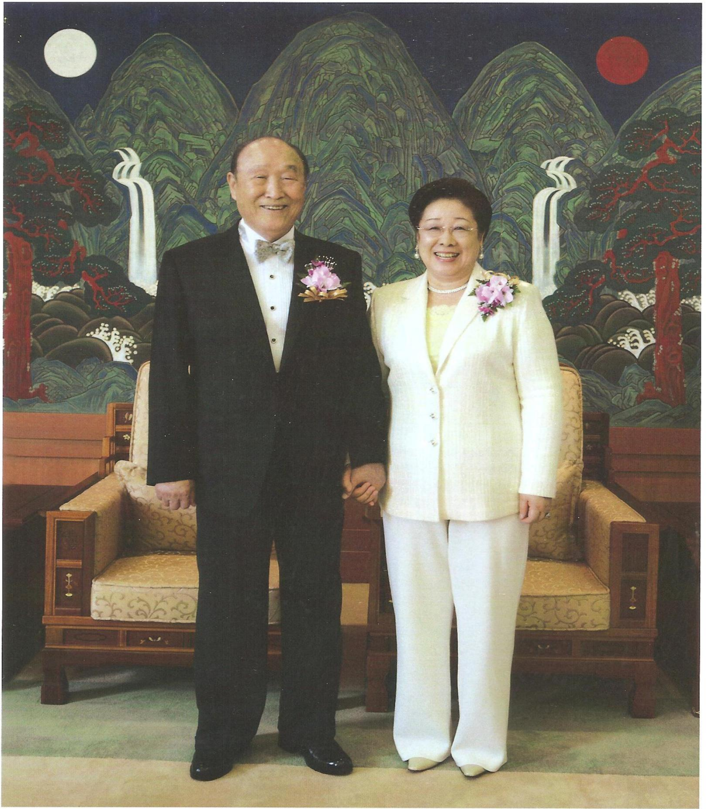
Rev. Dr. Sun Myung Moon and Dr. Hak Ja Han Moon